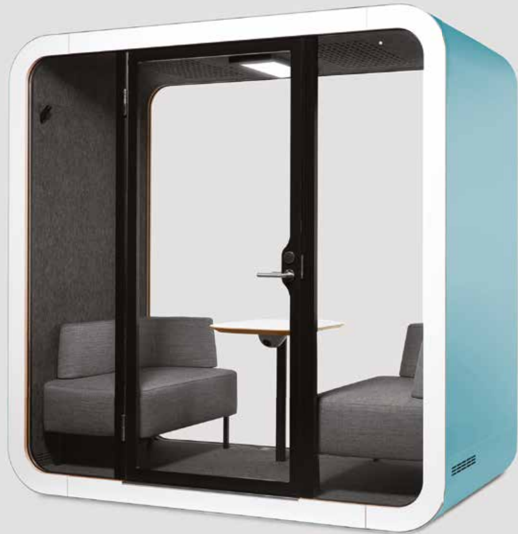
Cabine Q - FRAMERY

CONCENTREZ-VOUS SUR UNE AUTRE MANIÈRE DE TRAVAILLER